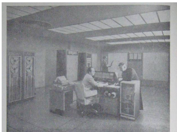
O Computador Eletrônico Burroughs 205

Parte do acervo de fotos do Projeto Comunicar, que encontrava-se em envelopes sem identificação completa. Parte das fotos desse foi reproduzida no Jornal PUC Notícias, no Boletim da PUC, no PUC Urgente e e em Anuários da PUC-Rio.