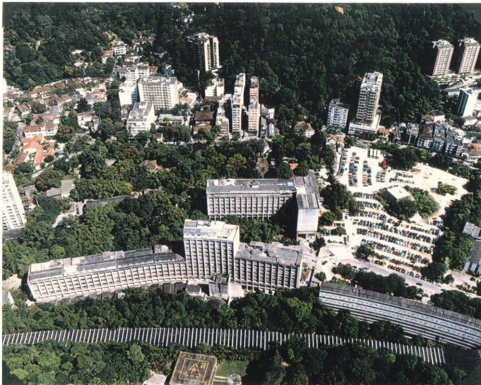
Imagem da área da PUC-Rio, aproximadamente 2000.

Origem: Acervo de fotos guardadas em armário da Reitoria, recebidas de diversas fontes e em diferentes momentos, ainda sem organização ou identificação específica.