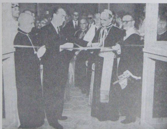
Inauguração do Computador Eletrônico pelo Presidente da República, Dr. Juscelino Kubitschek, por ocasião da visita do Eminentíssimo Sr. Cardeal Montini