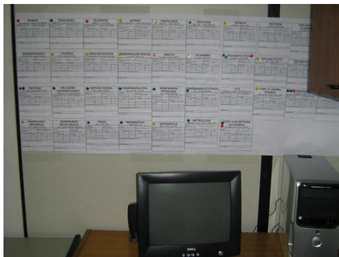
Quadro de Planejamento e Execução do trabalho de Pesquisa, localizado em nossa sala de trabalho (K 302)

Ao longo das visitas, além dos procedimentos já mencionados, atualizávamos o Quadro de Centros, Unidades, Representações Estudantis, projetos e Coordenações, localizado em nossa sala de trabalho. Cada integrante do Projeto estava representado por uma cor diferente e, com ele, ficava mais claro identificar os lugares já visitados, os arquivos levantados, e planejar o trabalho de cada membro da equipe em cada momento.