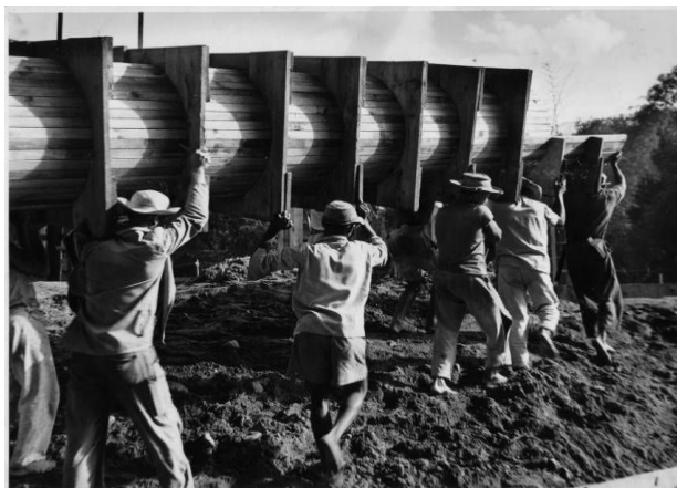
Construção dos Pilotis - 1953

Parte do acervo de fotos do Projeto Comunicar, que encontrava-se em envelopes sem identificação completa. Parte das fotos desse foi reproduzida no Jornal PUC Notícias, no Boletim da PUC, no PUC Urgente e e em Anuários da PUC-Rio.