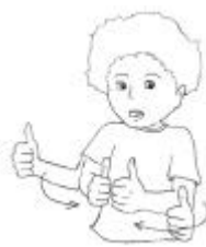
Adjetivo- junto, perto